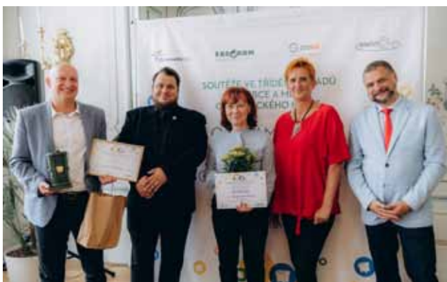
Zástupci města Velká Bystřice přebírají cenu za 3. místo.

Ocenění v soutěži za třídění odpadu v Olomouckém kraji je pro letošní rok rozdané. Velká Bystřice si Keramickou popelnici odvezla i letos, v kategorii měst a obcí s 2 001 - 15 000 obyvateli se město umístilo na třetím místě. Klání je už osmnáct let nedílnou součástí informační kampaně zaměřené na podporu sběru separovaného odpadu ve městech a obcích Olomouckého kraje. Do soutěže, kterou každoročně pořádá Olomoucký kraj se společností EKO-KOM, a.s., bylo zapojeno 399 obcí a měst našeho kraje. Hodnotila se vykazovaná data v systému EKO-KOM. Šlo především o množství vyříděných odpadů na jednoho obyvatele a počet tříděných komodit na území jednotlivých obcí a měst. Hodnocena byla mimo jiné i hustota sběrné sítě a další doplňková kritéria. Více informací najdete na www.jaksetociodpady.cz