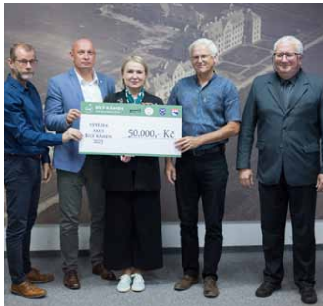
Foto: pořadatelé a organizátoři akce Bílý kámen předávají ministryni obrany šek pro Vojenský fond solidarity.