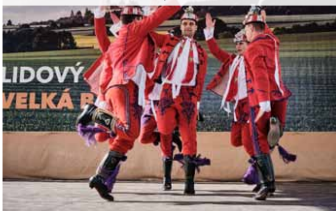
LIDOVÝ ROK 1. - 3. září