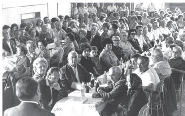
Foto ze setkání rodáků v sokolovně