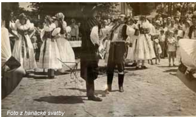
Foto z hanácké svatby