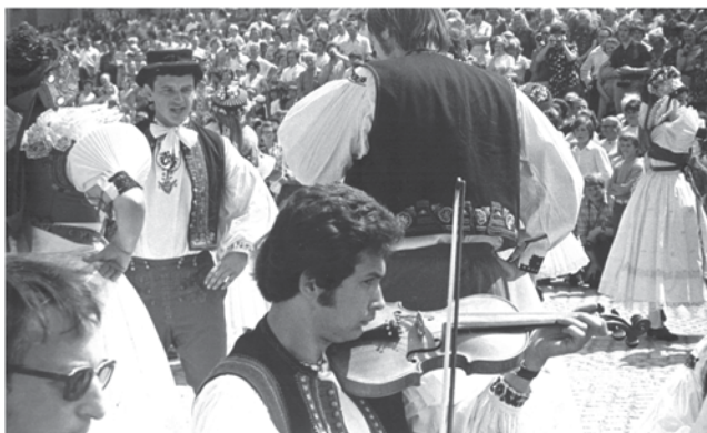
Foto z hanácké svatby