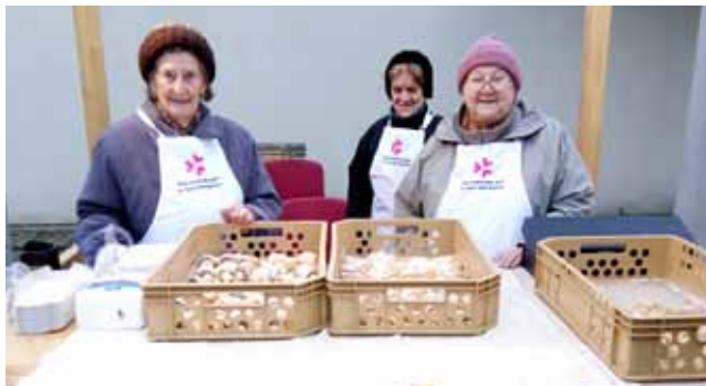
Klientky DPS prodávají vyhlášené svatomartinské rohlíčky

Naší zásadní výhodou je téměř absolutní soukromí, které klientům poskytujeme už téměř třicet let. Až na výjimky má každý svůj malý byt s vlastním sociálním zařízením a kuchyňským koutem, což je v krajském, možná i celorepublikovém měřítku unikát. Druhým klíčovým prvkem je personál, který ke klientům přistupuje s respektem a důstojností. Pracovníci domova jsou obětaví lidé, kteří své práci dávají často víc, než musí. A protože roky přibývají nám všem, často si s kolegy říkáme, že práci na rozvoji našeho domova „děláme už sami pro sebe“, až se my sami staneme klienty této služby. To je přece ta nejlepší motivace, ne? ☺