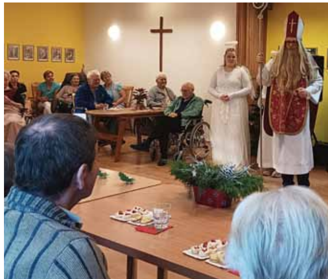
Mikulášská nadílka na DPS

Například sousední Bystrovany trvale spolufinancují jedno místo (lůžko, byt) v našem domově.