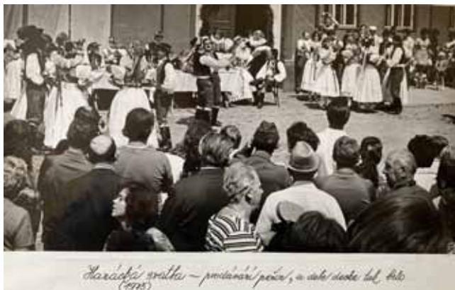
Foto z hanácké svatby