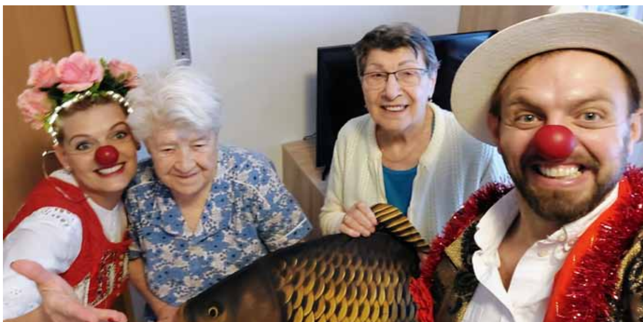
Zábavné odpoledne pro seniory