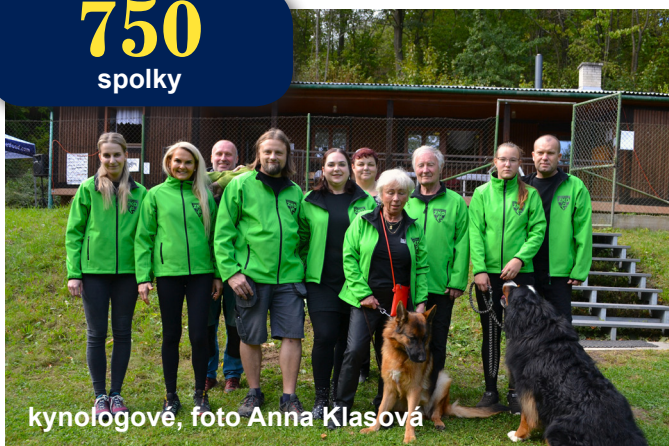
kynologové, foto Anna Klasová