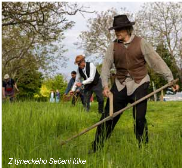
Z týneckého Sečení lúky