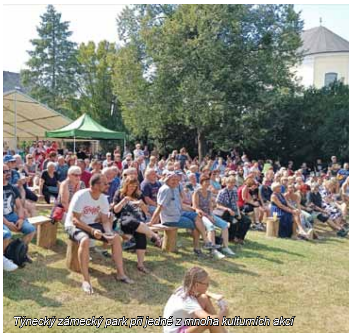
Týnecký zámecký park při jedné z mnoha kulturních akcí