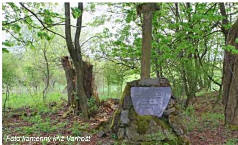
Foto kamenný kříž Varhošť