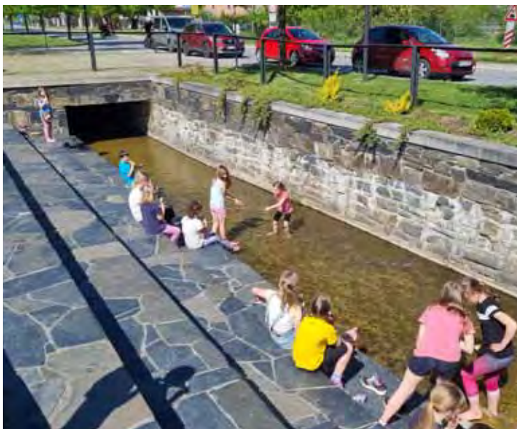
Vybetonované dno náhonu slouží jako brouzdaliště