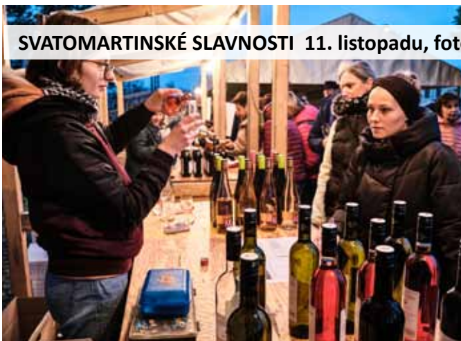
SVATOMARTINSKÉ SLAVNOSTI 11. listopadu