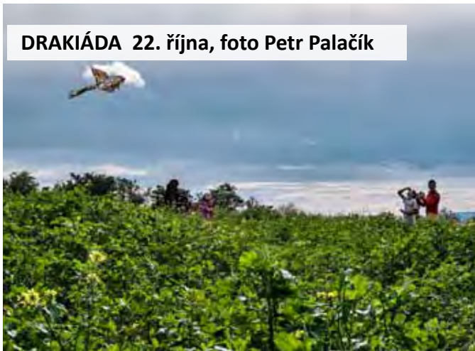
DRAKIÁDA 22. října