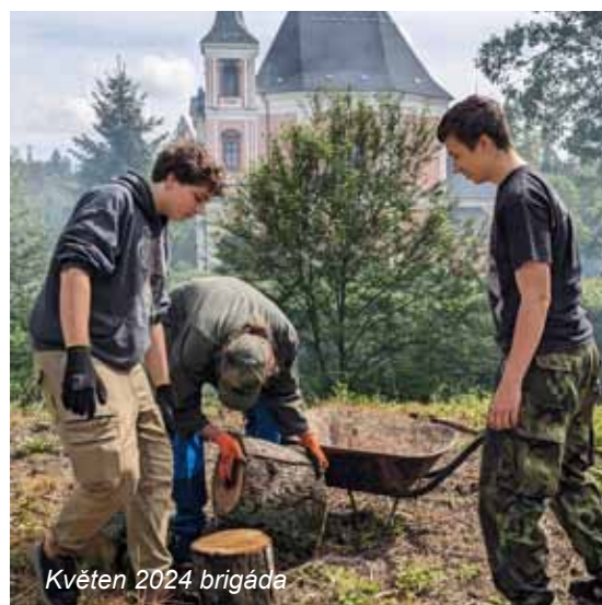
Květen 2024 brigáda