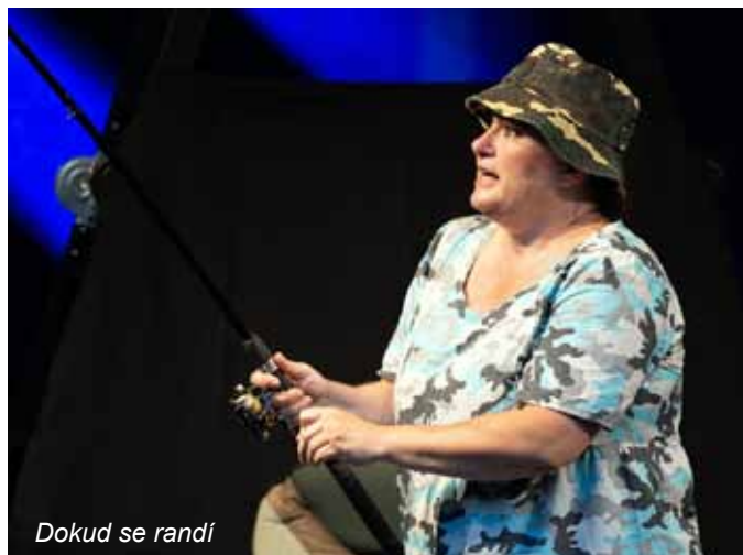
Dokud se randí