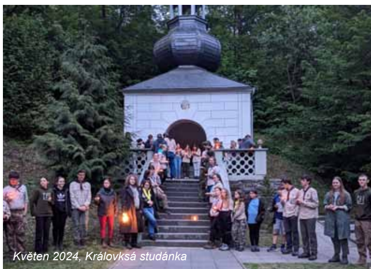
Květen 2024, Královská studánka