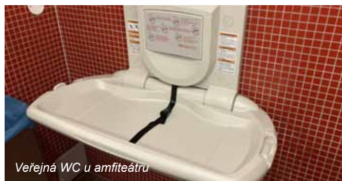
Veřejná WC u amfiteátru