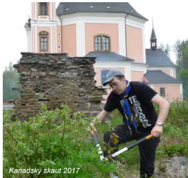
Kanadský skaut 2017