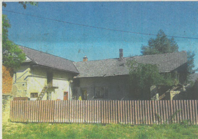
ZDE BUDE DŮM SLUŽEB. Před dvěma lety obecní úřad vydražil dům v centru Luká, na jehož místě plánuje postavit dům služeb. Zchátralou

Luká nabízí novým obyvatelům slušné zázemí. Má školu, školku, plánuje postavít