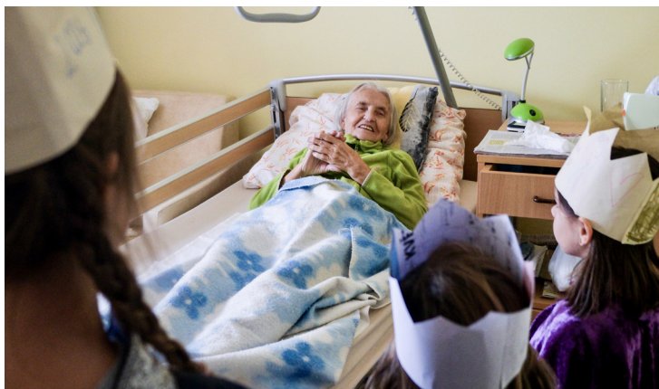
Tři králové na návštěvě v hospicu