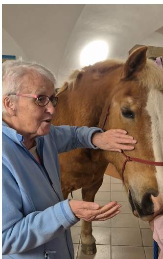
Hipoterapie v hospicu