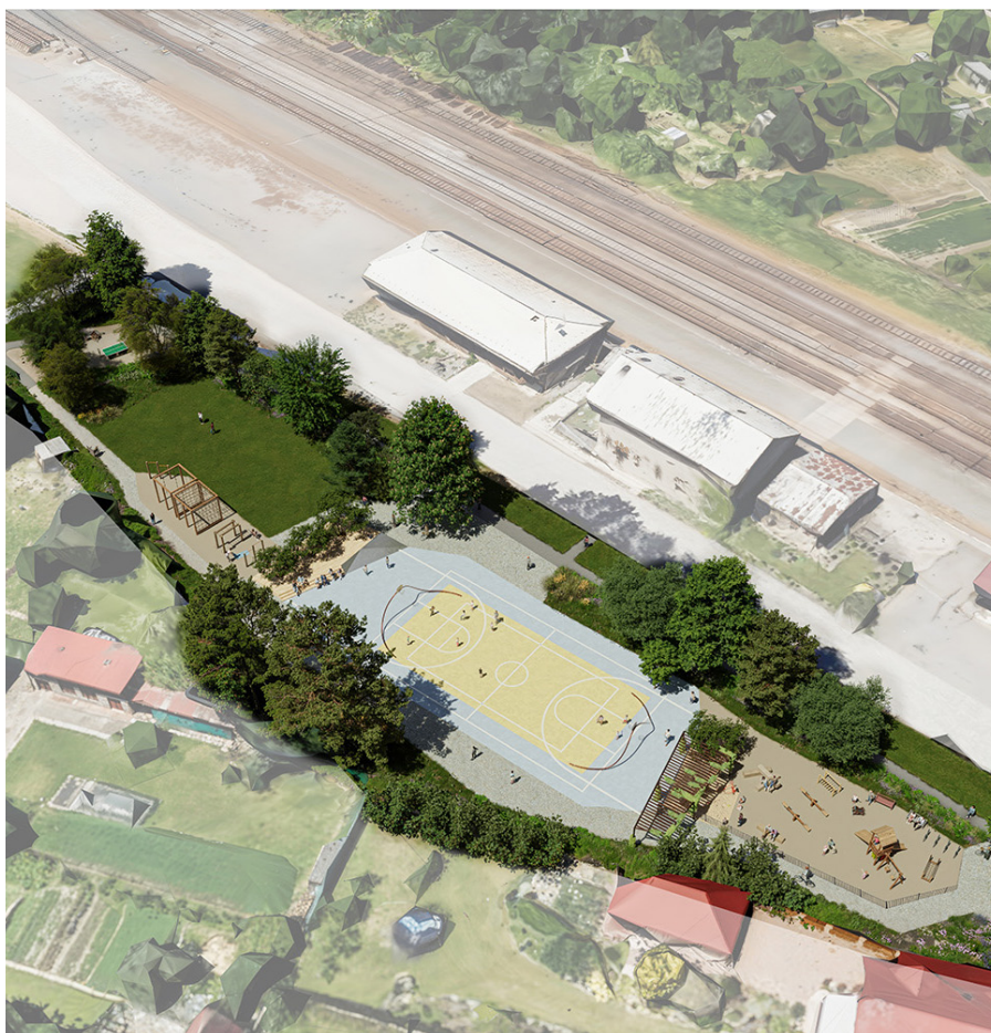
Vizualizace Revitalizace přednádražního prostoru