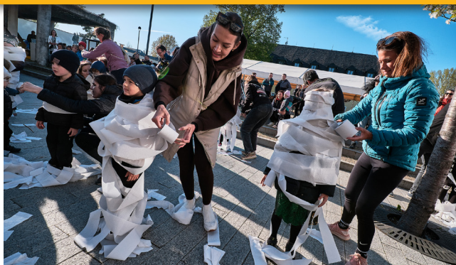
Pálení čarodějnic a Stavění mája 30. dubna