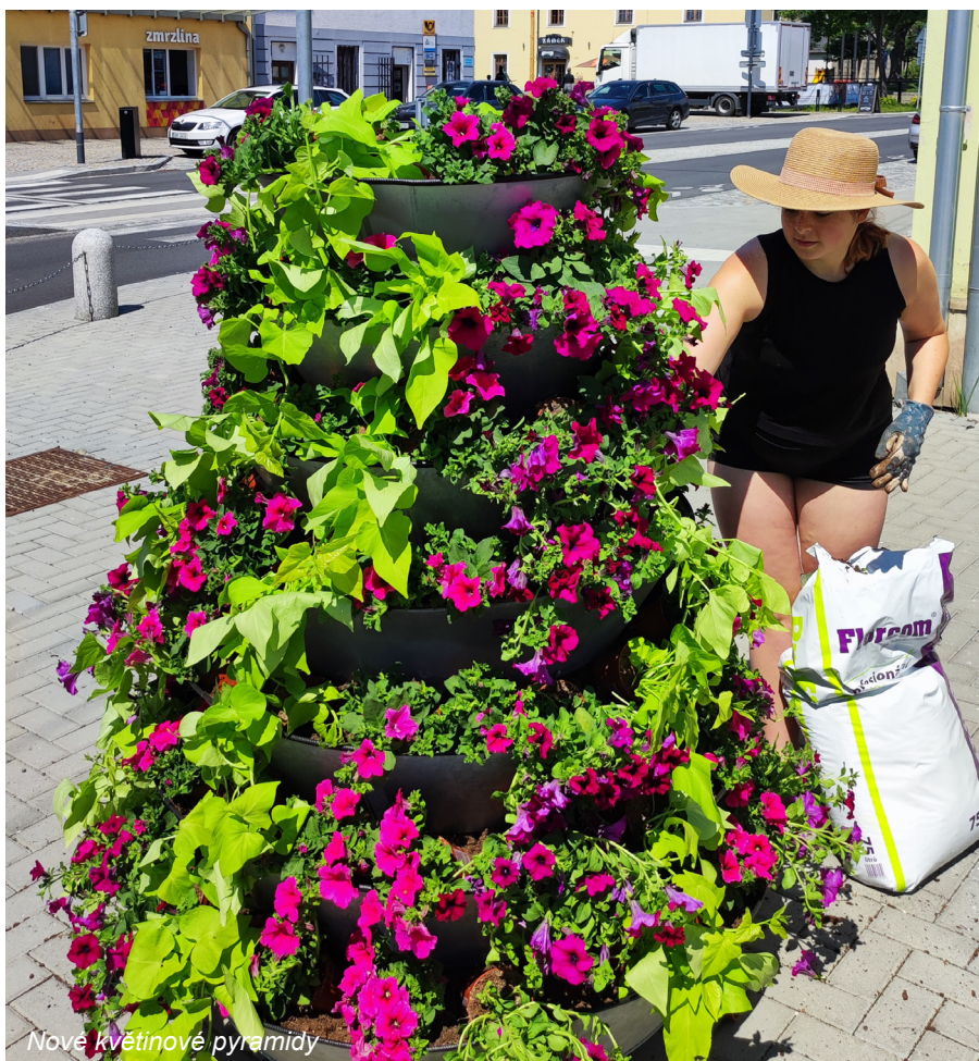
Nové květinové pyramidy